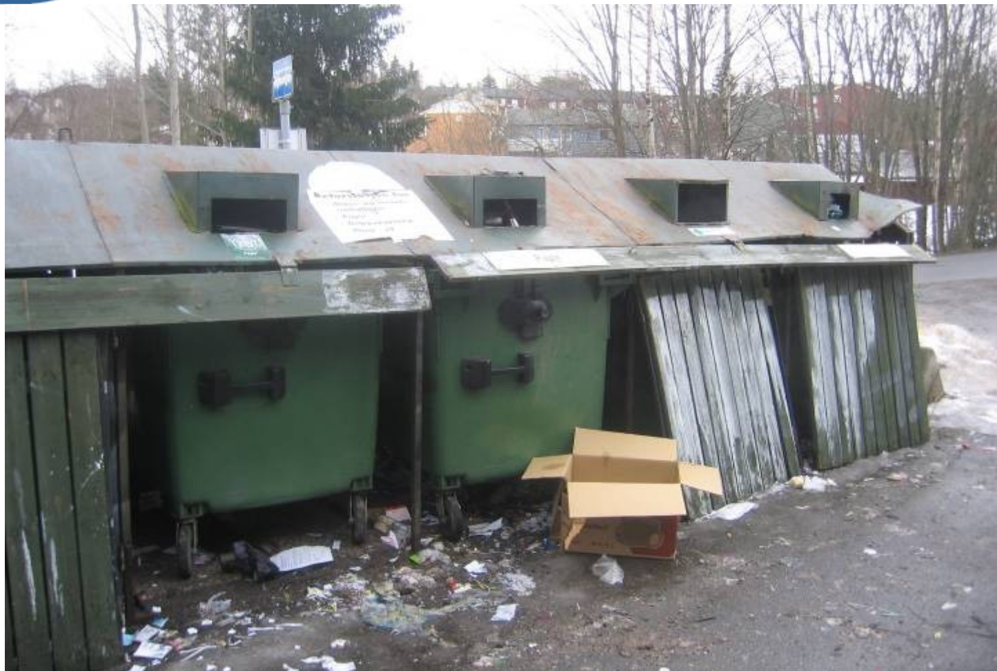
Returstasjon i Johan Herman Wessels vei – mars 2007