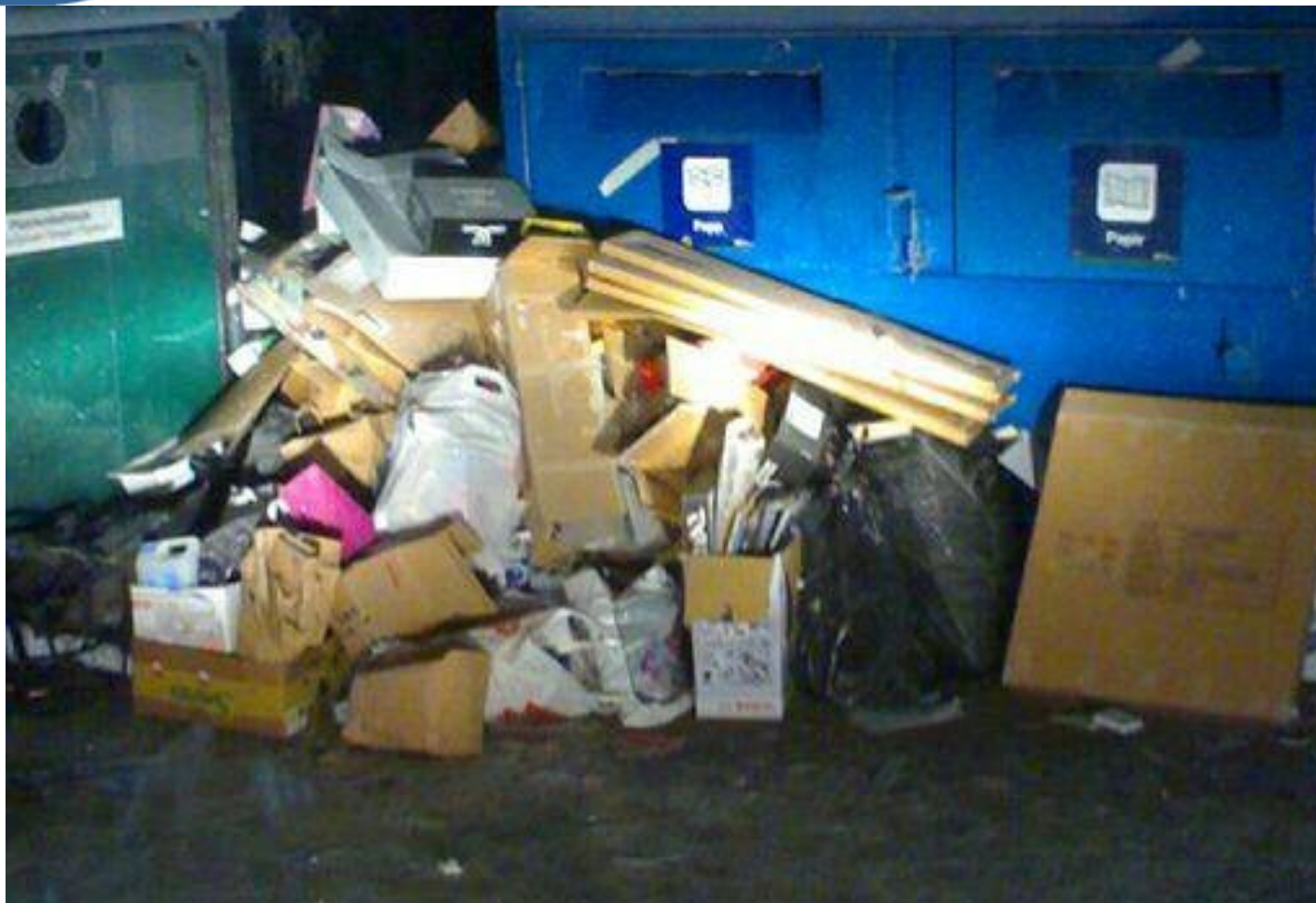
Returstasjon v/ Statoil Vestby – desember 2006